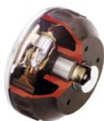
Roulement étanche remorque freinée