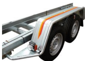
Marche pieds, renfort tubulaire et garde boues acier galvanisé