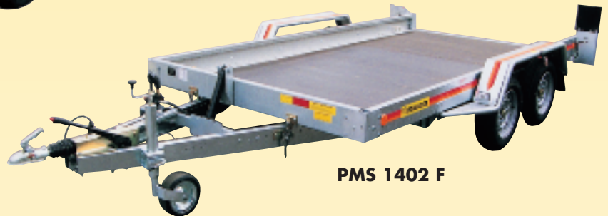
PMS 1402 F