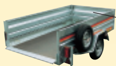
Jeu de 3 ridelles (hauteur + 400 mm)